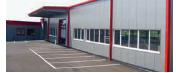
Die Koller & Kunesch GmbH hat ihren Sitz mit 2.500 m 2 Produktions- und Verwaltungsfläche seit 2007 in der Bahnhofstraße 4 in Lamprechtshausen, einer Gemeinde im Norden des österreichischen Bundeslandes Salzburg.

Neu ist die Hardcover-Produktion bis etwa 1.500 Exemplare, wofür Kunesch zusätzlich in eine Deckenmaschine investierte.